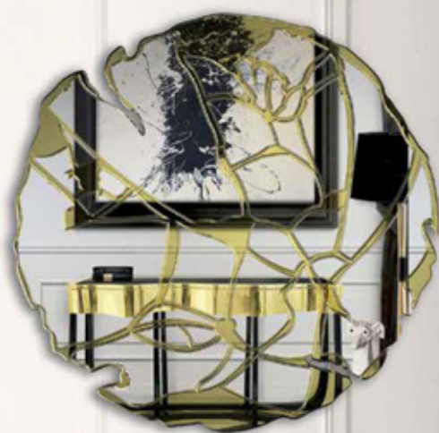
Консоль Newton и зеркало Glance от Boca do Lobo

На грядущий сезон португальские мебельные компании единогласно сделали ставки на элегантное сочетание черного и приглушенного золотого, в чем их с удовольствием поддержали европейские коллеги. Слепящий блеск золота уже не первый год остается за кулисами модных тенденций, сегодня же в главных ролях сдержанно состаренные и матовые оттенки теплых металлов. Округлые и строгие геометрические формы, глянцевые поверхности и отделка латунью как нельзя кстати подчеркивают изящность современных трендов. Медь, бронза, латунь, матовый хром выходят в этом году на первый план, гармонично освежая излюбленный черный цвет. Обойные и текстильные бренды же откликнулись на этот тренд инкрустациями медных и серебристых нитей в текстильные и настенные покрытия, виртуозными технологиями тиснения и фольгирования обоев, а также легким золотистым градиентом тканей.